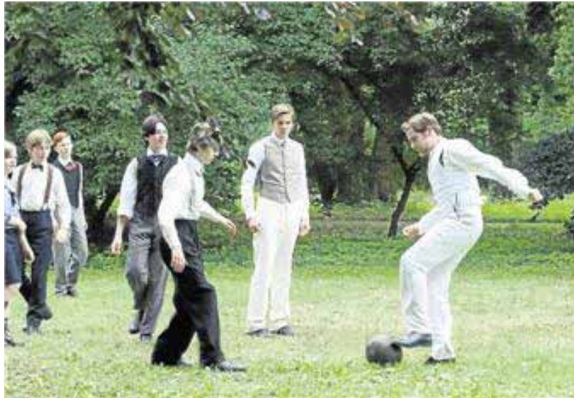
Daniel Brühl (r.) spielt den unkonventionellen Gymnasiallehrer Konrad Koch im Film „Der ganz große Traum“ (Kinostart: 24. Februar). Zum Länderspiel Deutschland gegen Italien heute in Dortmund wurde der Film gestern Medienvertretern gezeigt.

Bereits im Alter von 16 Jahren erkrankte Bernhard lebensgefährlich an Tuberkulose. Krankheit war sein lebenslanger Begleiter – mit 58 starb er an Herzversagen. Existenzielle Fragen rund um Einsamkeit, Krankheit und Tod wurden somit auch zu zentralen Motiven in seinen Texten. Zitat Bernhard: „Eine einzige Sache ist gewiss: der Tod, dieser Grill, auf dem wir alle als Braten enden. Aber niemand weiß genau, worin er besteht.“ dpa/kapf