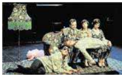
In Peter Pans Spiel- und Spaßwelt haben Kleidung und Möbel das gleiche Muster.

Theater: „Peter Pan and the lost boys“ im Theater an der Ruhr